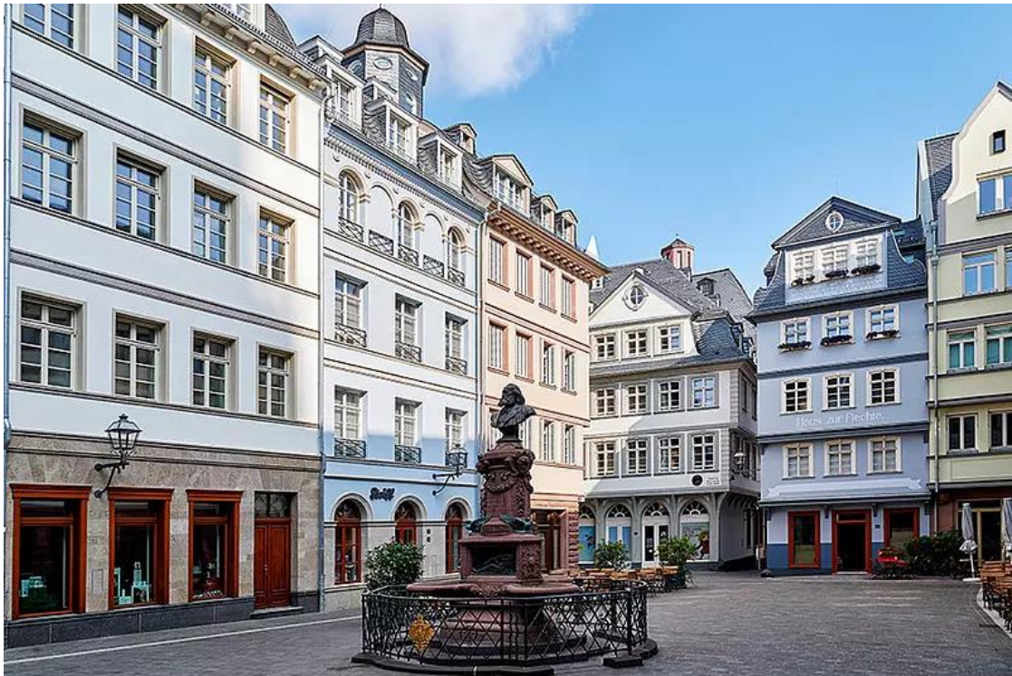
Nach dem Wiederaufbau: Rekonstruierte und neu interpretierte Fassaden am Hühnermarkt, historisches Denkmal des Frankfurter Mundartdichters Friedrich Stoltze im Bild vorne